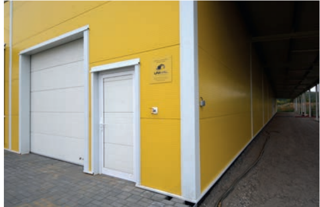
Klempířské zapravení haly

Montovaná hala na první pohled zaujme výraznou barevnou kombinací žluté a bílé barvy. Zářivá žlutá barva v RAL 1021 je zkombinovaná s bílou střechou v RAL 9010 a bílými klempířskými prvky,