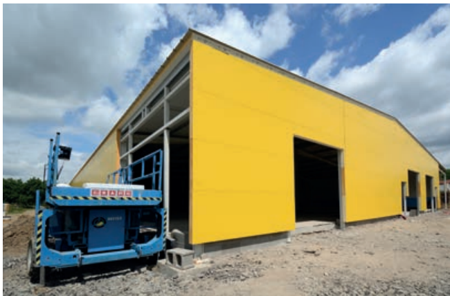
Montáž opláštění haly