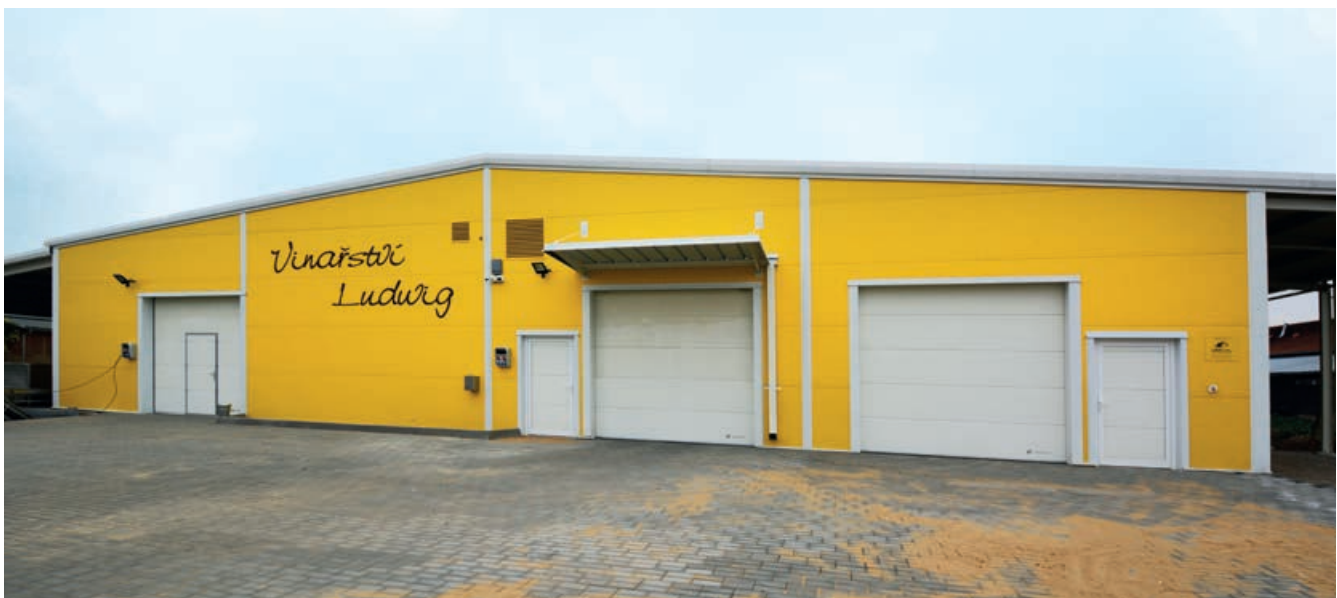
Montovaná hala – Vinařství Ludwig