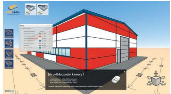
CAD konfigurátor hal