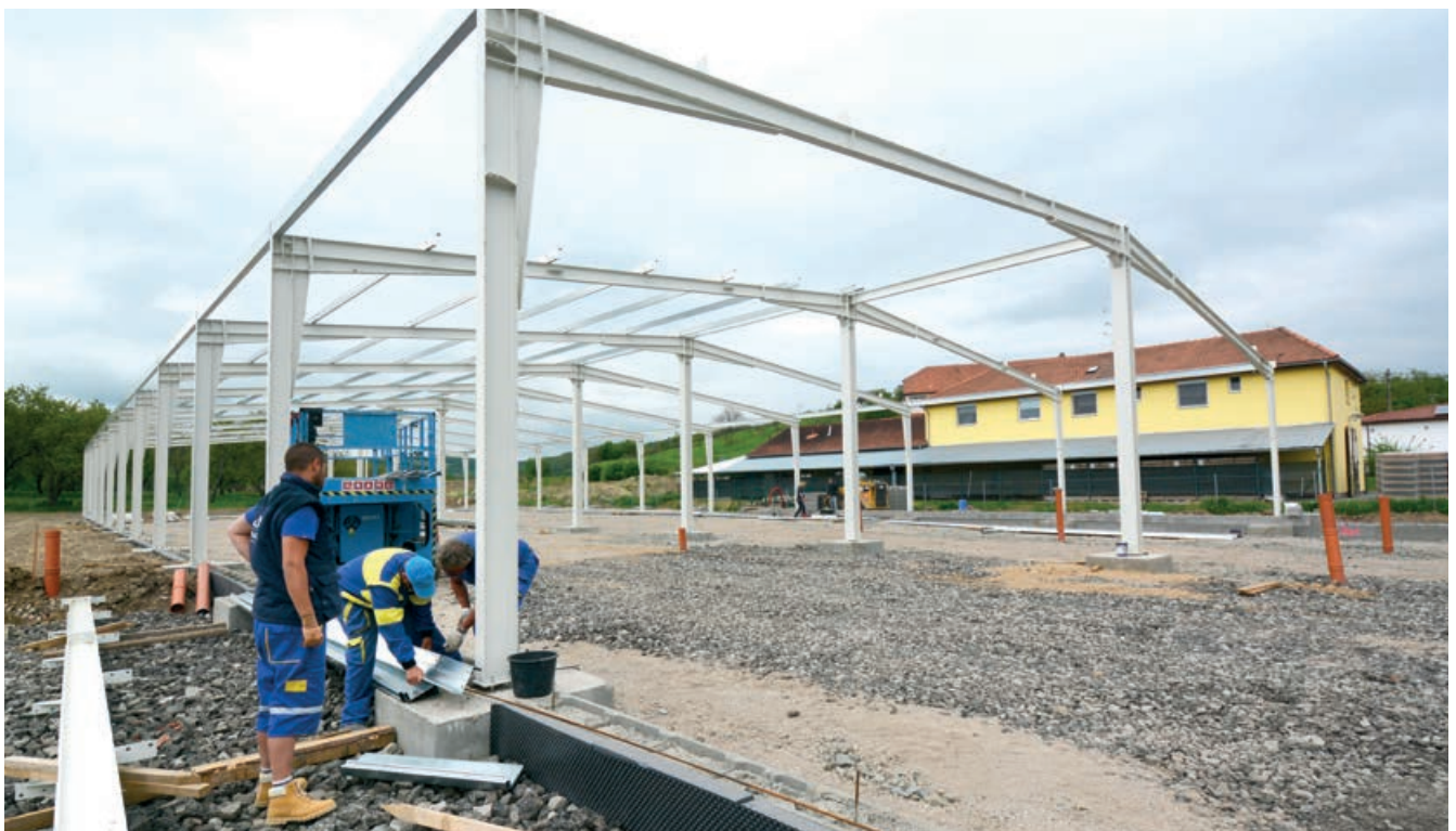
Montáž ocelové konstrukce haly Ludwig