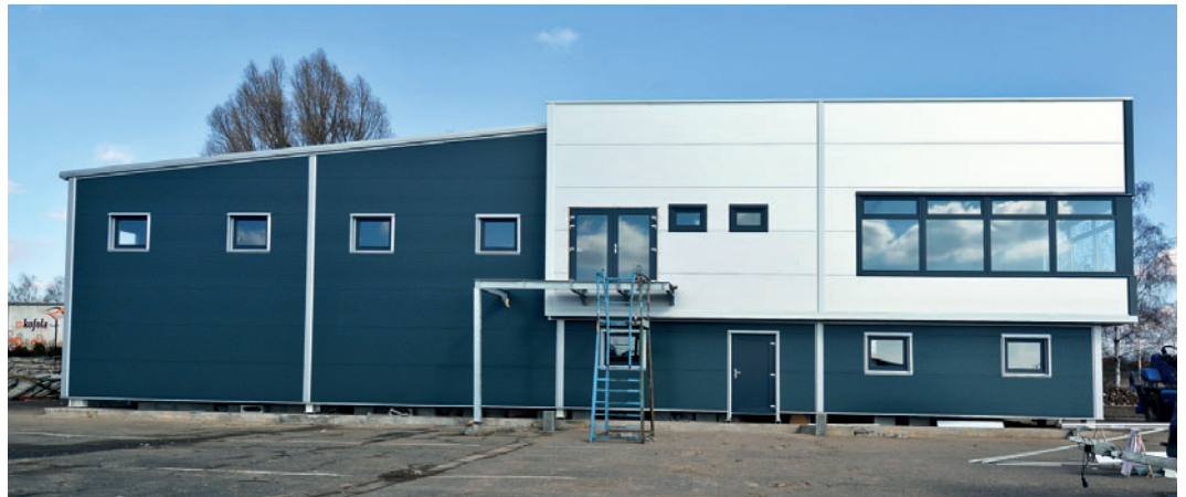
Hala MB Transport Mnichovo Hradiště

Hala MB Transport je konstrukčně řešena s předsunutou administrativou mimo základní půdorys haly. Kombinuje atiku se sedlovou střechou, což doplňuje barevná kombinace panelů a klemprířských prvků. Technicky nejsložitějším detailem zde bylo vynešení rohového sloupu, přes který prochází prosklená sestava mimo půdorys.