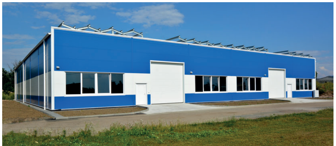
Hala Altech Uherské Hradiště

Velmi zdařilá projekce a realizace se povedla při výstavbě haly DPK Olomouc . Konstrukčně byla výrobní hala rozdělena na dva úseky s jeřábovou dráhou a navazujícím administrativním zázemím v pultovém provedení. Barevná kombinace haly v odstínu červenošedo-bílé je v našem odvětví velmi ojedinělá a investoři, kteří nemají zájem o fádňí šedý standard, jsou nadšeni.