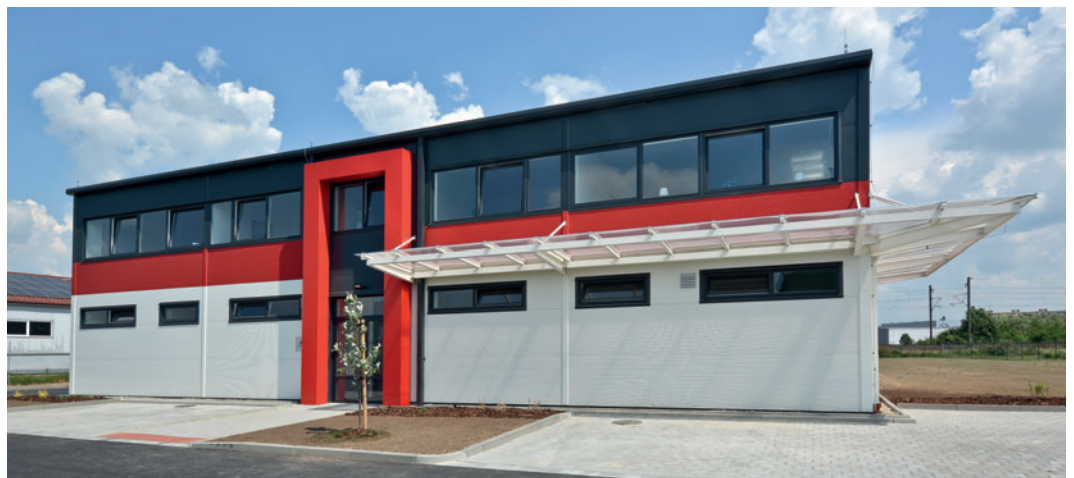
Administrativně-výrobní hala DPK MORAVA Olomouc