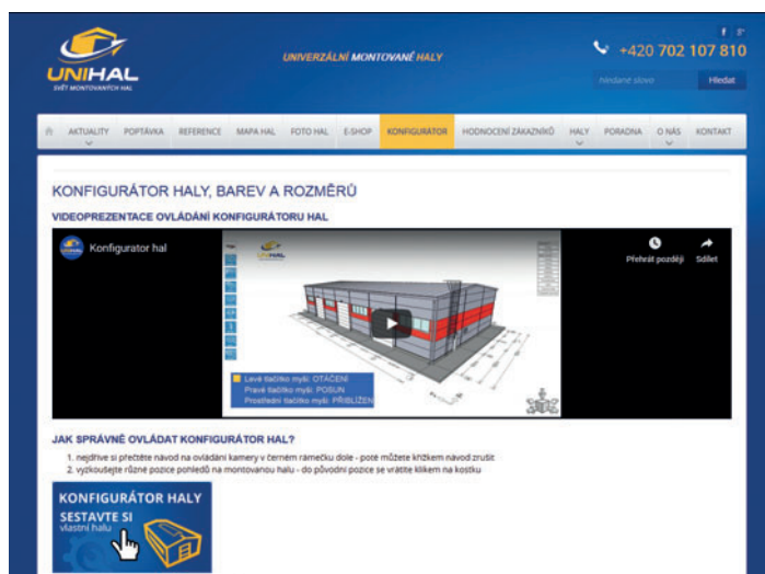
Konfigurátor montovaných hal

V případě zájmu o výstavbu haly by měli potenciální investoři zvážit, zda jim vyhovuje typová hala nebo mají zájem o své vlastní řešení. V případě, že se jim líbí a vyhovuje typové řešení uvedené v e-shopu, je možné provést nezávaznou objednávku a zaslat své iniciály ke zpracování cenové nabídky. V tomto případě se jeden z obchodníků ozve max. do jed-